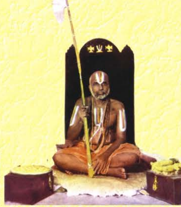
43ம் பட்டம் அழகியசிங்கர்