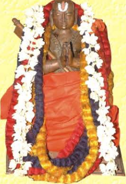
35ம் பட்டம் அழகியசிங்கர்