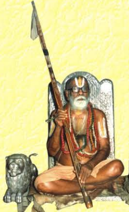
44ம் பட்டம் அழகியசிங்கர்