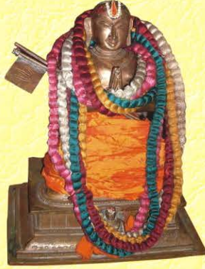
34ம் பட்டம் அழகியசிங்கர்